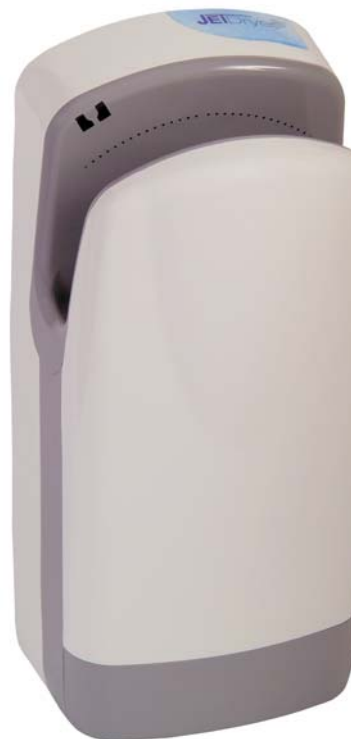
provedení BF – ABS, bílý