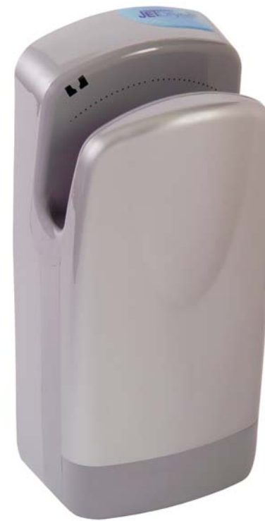
provedení SF – ABS, stříbrný matný