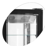
Dveře bez rámu