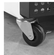
Pevná kolečka jako volitelné příslušenství

Mrazicí skříň s prosklenými dveřmi, nerezové provedení