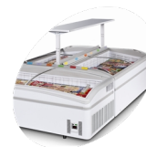
Instalace do ostrůvků, police jako volitelné příslušenství