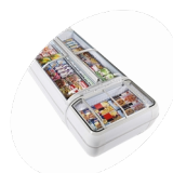
Instalace do sestavy ostrovů