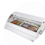
Police jako volitelné příslušenství