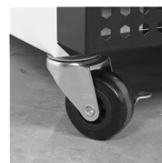
Pevná kolečka jako volitelné příslušenství

Chladicí skříň jednodveřová s prosklenými dveřmi, nerezové provedení.