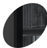
Dveře bez rámu