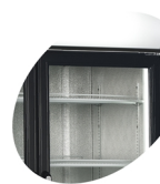
Svislé vnitřní osvětlení

Chladicí skříň dvoudveřová prosklená s posuvnými dveřmi (náhrada za NORDline USS 1200 DIKL).