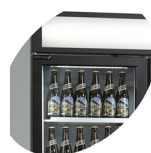
LED osvětlení v rámu dveří