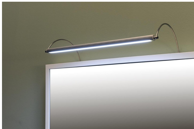
Obr.2 - Ukázka instalace svítidla nad zrcadlem.