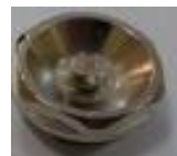
1x odvzduš. ventil (F)