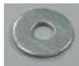
4x podložka (D)