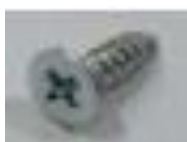
4x bezp. šrouby