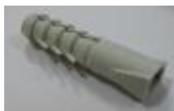
4x hmoždinka (B)