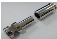
4x držák (A)