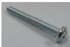
4x upevňovací šrouby (C)