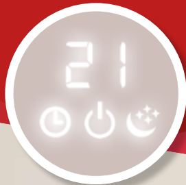
PODSVĚTLENÝ STAVOVÝ DISPLAY